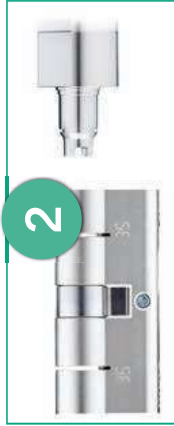
Profilzylinder entsprechend der Tür auswählen