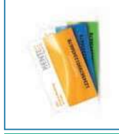
Masterkartensatz wird nur einmal pro Anlage benötigt!