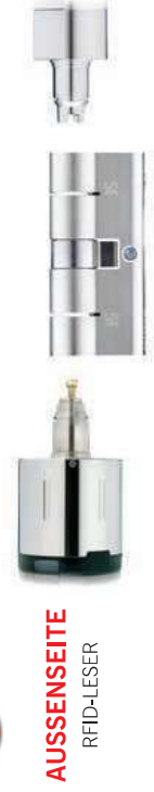
Funk Türknauf auswählen